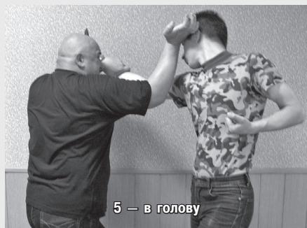
5 — в голову

и освобождении от захватов. Удары ребром ладони наносятся снаружи-вовнутрь, изнутри-наружу, сверху-вниз и с разворотом-назад. Отрабатывать удар следует на «лапах», «макиваре», боксерском мешке, стволах деревьев.