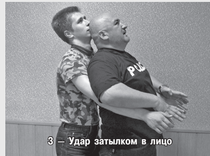
3 — Удар затылком в лицо