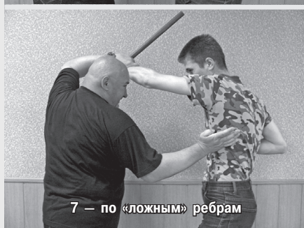
7 — по «ложным» ребрам