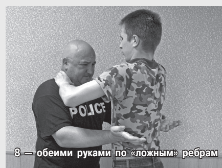
8 — обеими руками по «ложным» ребрам