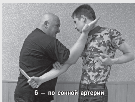
6 — по сонной артерии