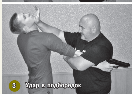
3 Удар в подбородок