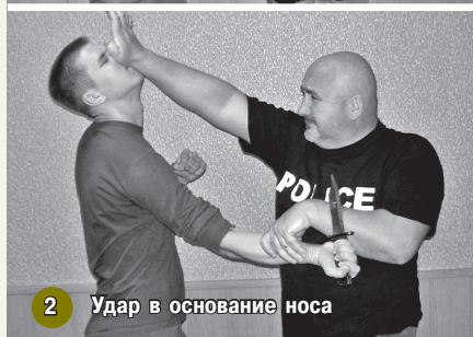
2 Удар в основание носа