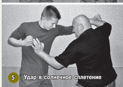
5 Удар в солнечное сплетение