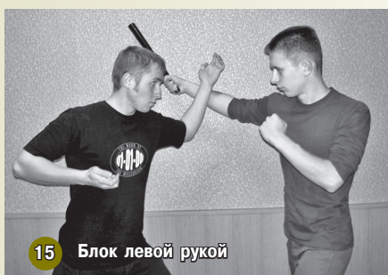
15 Блок левой рукой