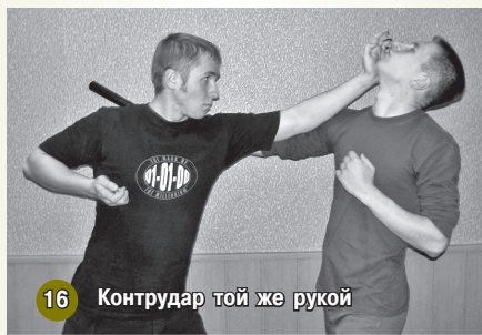
16 Контрудар той же рукой