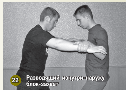
22 Разводящий изнутри-наружу блок-захват