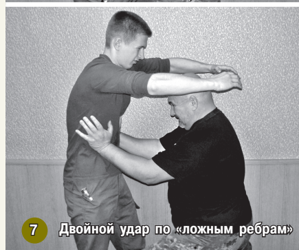
7 Двойной удар по «ложным ребрам»