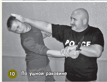
10 По ушной раковине