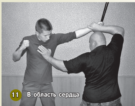
11 В область сердца