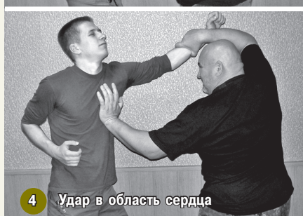
4 Удар в область сердца