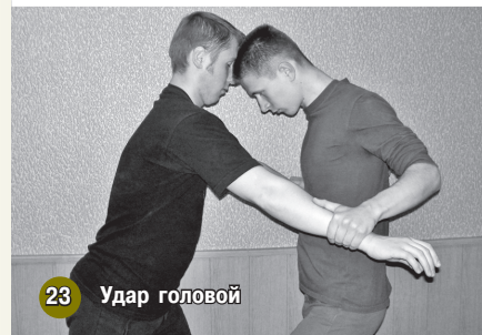
23 Удар головой