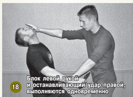
18 Блок левой рукой и останавливающий удар правой, выполняются одновременно