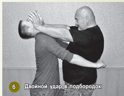
6 Двойной удар в подбородок