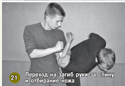
21 Переход на загиб руки за спину и отбирание ножа