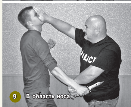
9 В область носа