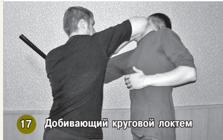
17 Добивающий круговой локтем