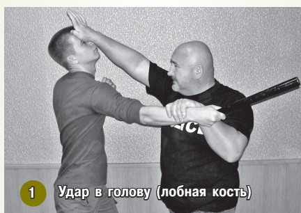
1 Удар в голову (лобная кость)