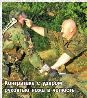
Контратака с ударом рукоятью ножа в челюсть