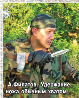
А. Филатов. Удержание ножа обычным хватом