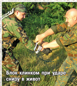
Блок клинком при ударе снизу в живот