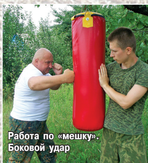
Работа по «мешку». Боковой удар