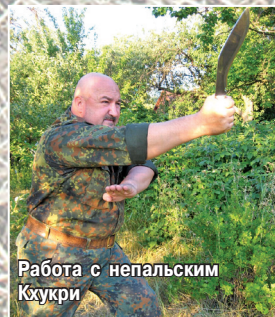
Работа с непальским Кхукри