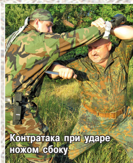
Контратака при ударе ножом сбоку