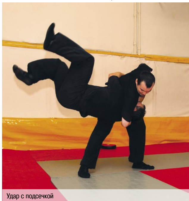
Удар с подсечкой