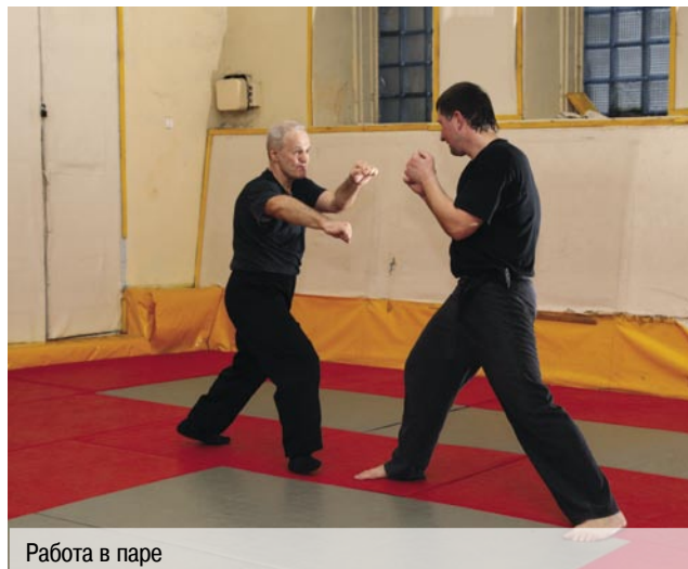
Работа в паре

Сложен уровень координации движений – в реальном бою ведь не столь быстрый темп, как на отработке по воздуху. Тут не только координация важна, а и глобальный уровень контроля над телом. Помните, как у Кастанеды: «Уникальный уровень силы соответствует уникальному уровню контроля». Кун-фу – это и есть своеобразный уровень медитации от контроля над телом к контролю над духом.