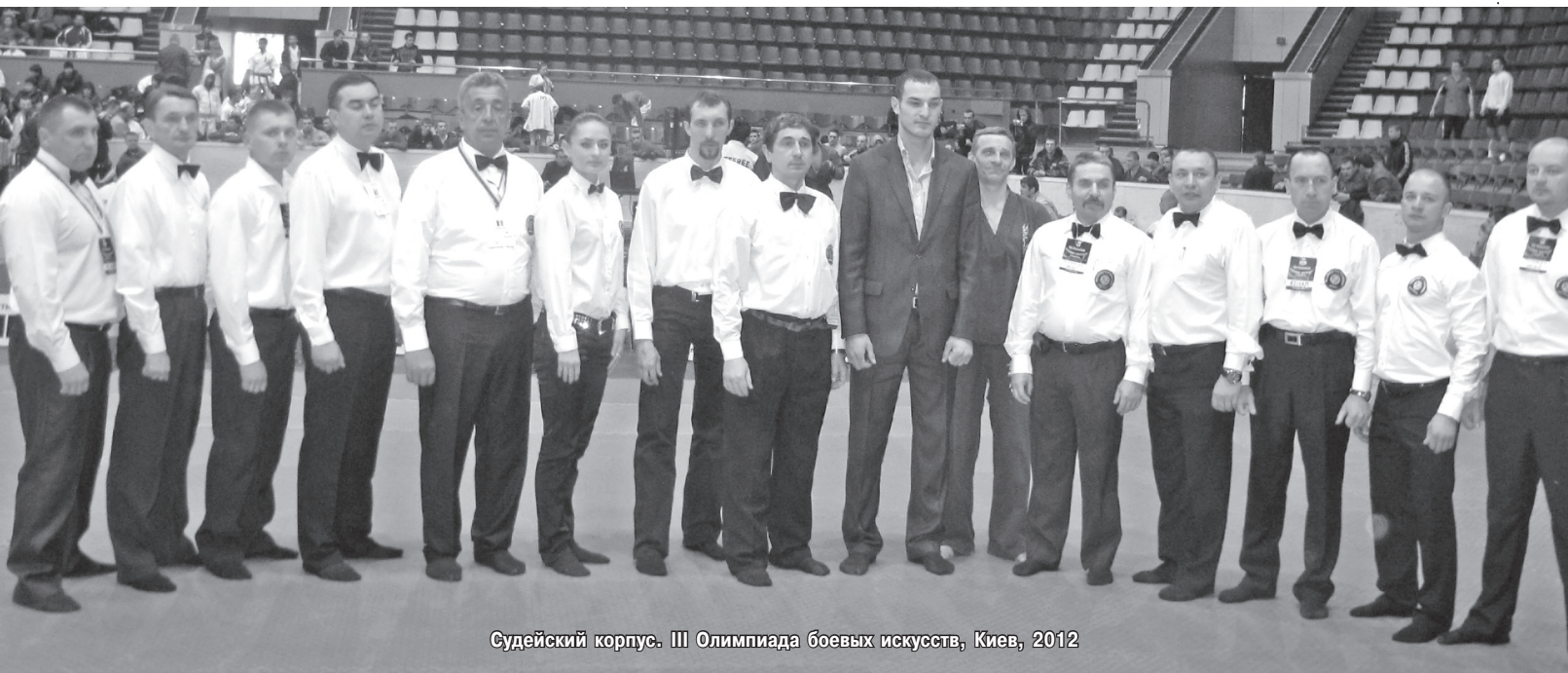
Судейский корпус. III Олимпиада боевых искусств, Киев, 2012

в Азию... Просто знаете, на каком-то этапе не захотелось рекламировать чужую традицию, потому что должна