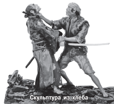
Скульптура из хлеба

Пропагандируя боевые искусства, в городе Харькове под эгидой ассоциации Тоуаквай с успехом прошла необычная выставка — миниатюрная скульптура из хлеба под названием «Волшебный мир боевых искусств». Эта выставка посвящена двум народам Украины и Японии, их духу — казацкому и самурайскому. Украина и Япония — единственные страны в мире, пережившие ядерную катастрофу: 1945 год — Нагасаки, Хиросима; 1986 год — Чернобыль. На макете этих стран были представлены пятнадцатисантиметровые фигурки воинов — казаков и самураев, а также представителей дзюдо, айкидо, каратэ, кэндо, касабо, гопак. Фигурки искусно раскрашены и покрыты лаком, динамичны и поразительны. Эта выставка, своего рода, предупреждение человечеству — не играйтесь с атомом! Кстати, на эту тему был выпущен красочный настенный календарь.