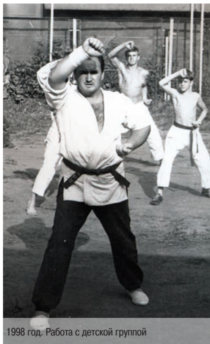
1998 год. Работа с детской группой

— Да чем. Противники-то все оказались на полу, а вот как они туда попали — вопрос. Мастера работали быстро — округлыми короткими формами, а они максимально эффективны в реаль-