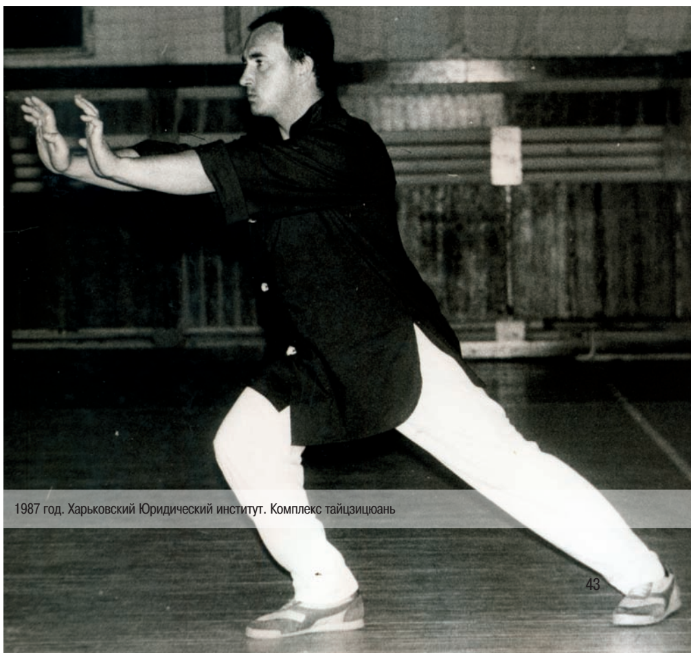
1987 год. Харьковский Юридический институт. Комплекс тайцзицюань

— Может же быть не асфальт, а, к примеру, ступеньки, возвышение, да мало ли что? Жизнь есть жизнь. Так что правильно упасть — это тоже искусство, а уж что по-