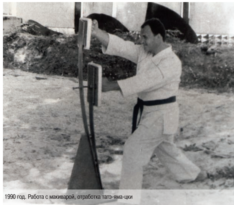
1990 год. Работа с макиварой, отработка татэ-яма-цки