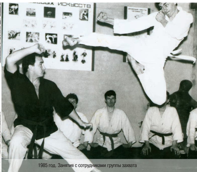
1985 год. Занятия с сотрудниками группы захвата

Часто приходится сталкиваться с недопониманием на первичном этапе участниками опергрупп уже упомянутых выше целей и задач. К примеру, какой-нибудь боец-«ударник» не преминет заметить: «Буду я возиться, крутить руку, мне легче левой в печень, правой в голову». Минуточку, ребята, вы забываете, что есть понятие «превышение». Вы же сами себя «закроете» в тюрьму. И когда переходишь к самой технике загибов, рычагов, обезоруживания и так далее, они начинают понимать значение системы силового задержания. Конечно, в чем-то техника устарела, поскольку преступники сейчас в основном такие же профи, работающие на уровне спецназа, хорошо вооруженные и снабженные техникой боевики. Среди преступников есть КМС и выше, и это далеко не редкость. Так что криминализация всех социальных слоев поставила другие задачи. Неподготовленный сотрудник