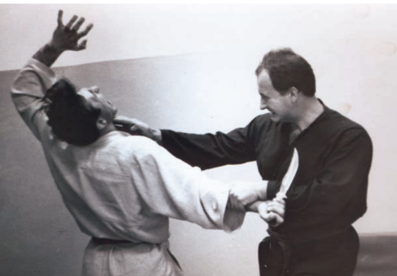
Работа с сотрудниками уголовного розыска. Обезоруживание

милиции справиться с ними не имеет шансов. Именно поэтому в последние годы культивируются сборные системы рукопашного боя, где есть ударная техника, броски, удушающие приемы и силовой контроль. Единственно, на мой взгляд, мало уделяется внимания оружию.