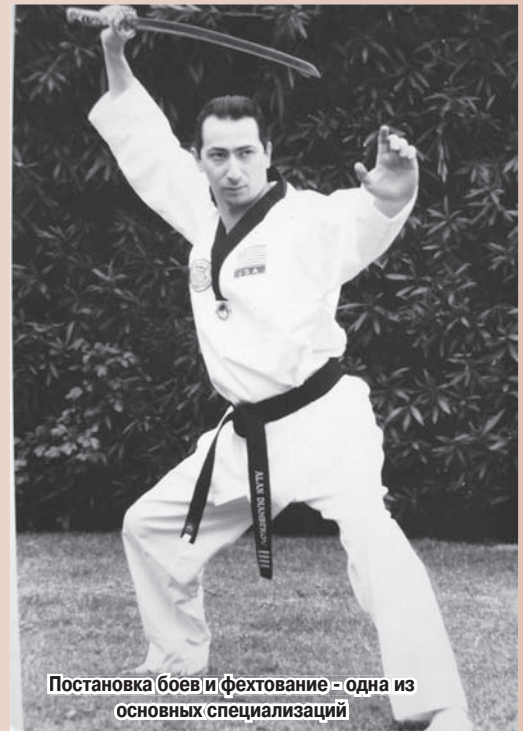
Постановка боев и фехтование - одна из основных специализаций