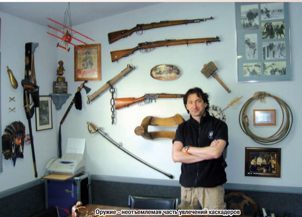
Оружие - неотъемлемая часть увлечений каскадеров

Творческая жилка, по всей видимости, от бабушки ещё пошла, она долгое время работала в коллективе известного фольклорного ансамбля танца «АЛАН». Ну а потом мама естественно