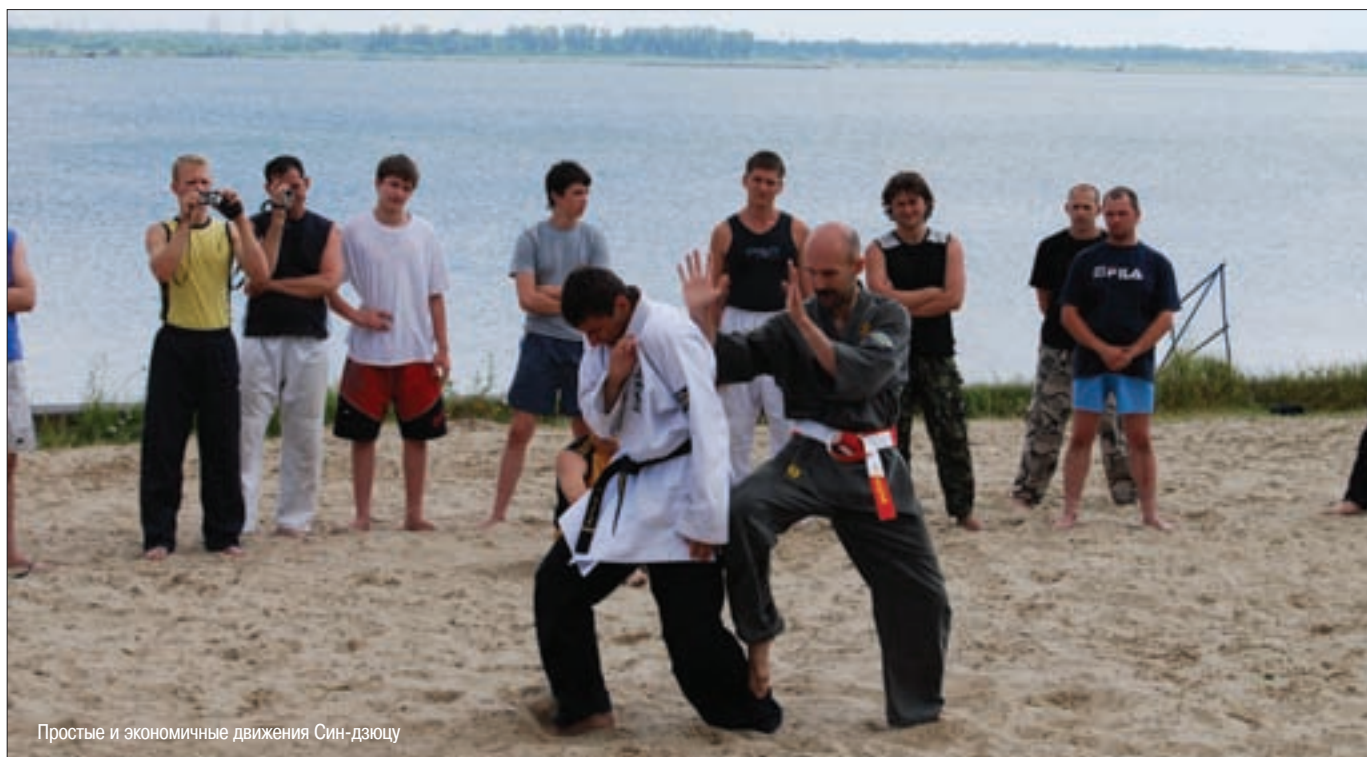
Простые и экономичные движения Син-дзюцу