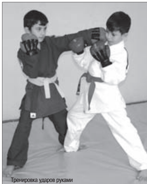
Тренировка ударов руками

Многие современные тренера не понимают, зачем нужны поклоны, делают это