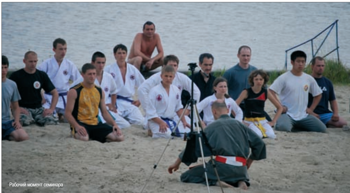
Рабочий момент семинара

КОБУКИ-ДЗЮЦУ и 2 дана ДЖИУ-ДЖИТЦУ и САМОЗАЩИТЫ.