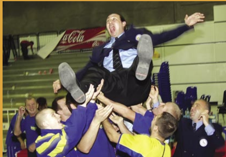
Радость победы. Украинская сборная победила тайцев на «их поле». Чемпионат Мира, Таиланд, 2004 г.

Я как-то слушал один комментарий, глупость для людей непосвященных. Один из комментаторов К-1, который вел репортаж по евроспорту, его сейчас уже убрали, говорил, «что тайцы набивают руки, ноги, корпус и даже голову». Но как можно набить голову?! Там у некоторых находится мозг, и у тайцев тоже. Так вот, мозг набить нельзя! Отбить можно, набить нельзя! Набивают части тела, которые при