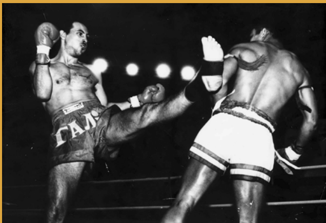
Бой за титул Чемпиона Мира среди профессионалов. Одесса, 1995 г.

эффективности и зрелищности этого вида единоборств. Тайландский бокс совершенно объективно признается одним из самых «боевых» видов. Америка и Европа, даже консервативная Япония единодушно признали и по достоинству оценили тайландский бокс. Конечно же, муэй тай изменился, попав на благодатную для своего развития почву других культур. Но основные тенденции этого развития определились в двух направлениях – массовый любительский тайландский бокс и профессиональный муэй тай. Любительский тайбокс испытал на себе все требования, предъявляемые к массовым видам спорта – гуманные правила, ограничение наиболее опасных техник, временной регламент, использование защитного снаряжения (щитки, шлем, нагрудник). Профессиональный же муэй тай сохранил, в принципе, все качества жесткого и бескомпромиссного искусства боя. В то время как европейские правила ограничивают работу локтями в голову, азиатские предоставляют бойцам полную свободу действий. Не случайно «муэй тай» можно перевести как «свободный бой» или «схватка свободных».