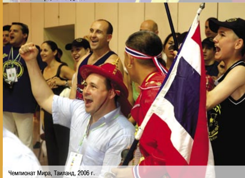
Чемпионат Мира, Таиланд, 2006 г.