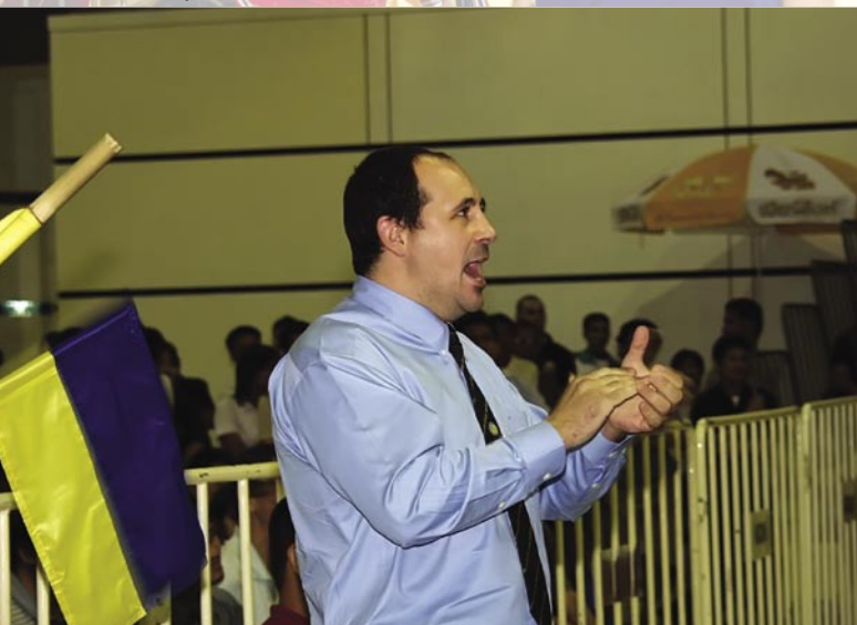
Чемпионат Мира, Таиланд, 2004 г.

подготовки – поединок в различных формах: условные и вольные бои, а также снарядная работа, наполняющая изученную технику силой и скоростью. Широко используемые протекторы, в сочетании с грамотной методикой преподавания, сводят к минимуму риск получения травмы. К тому же тайский бокс – это не просто набор приемов (ноги из тхэквондо, руки из бокса – встречаются еще такие точки зрения), а стройная система, позволяющая человеку в максимально короткие сроки овладеть техникой, тактикой, а также рядом физических и психологических качеств, необходимых для успешного ведения поединка. Тайский бокс очень стабилизирует и стимулирует жизнь.