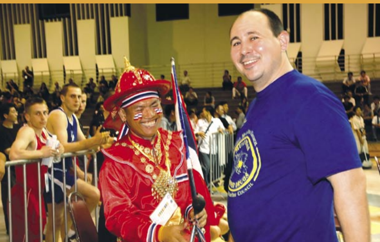
Чемпионат Мира, 2006 г.