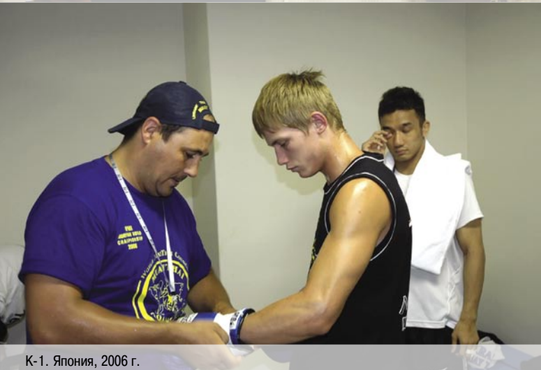
K-1. Япония, 2006 г.