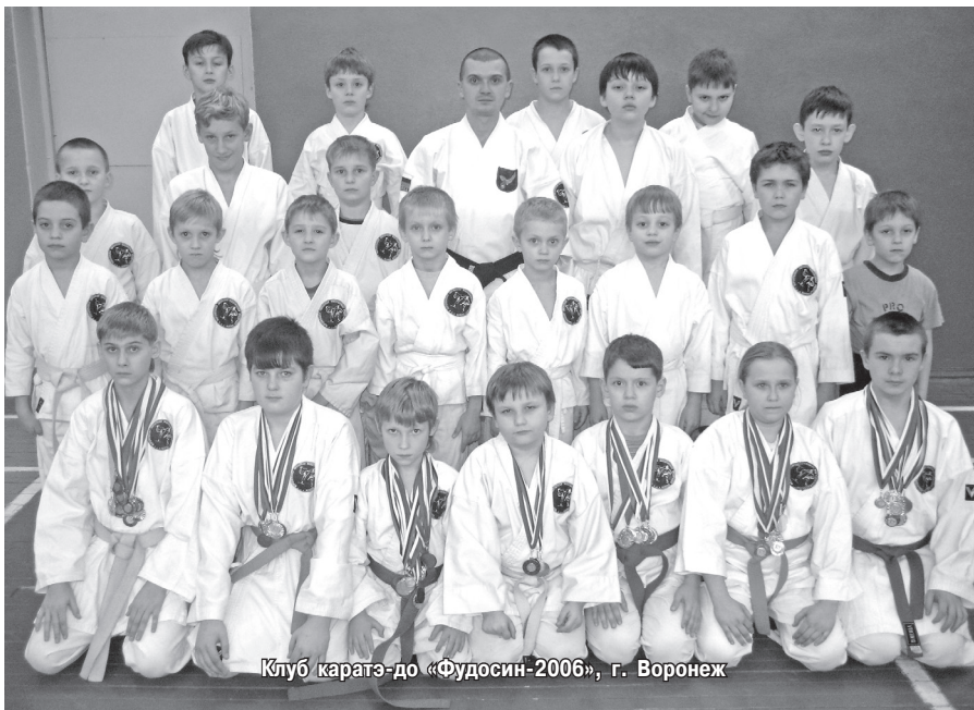
Клуб каратэ-до «Фудосин-2006», г. Воронеж

мандный дух. Что Вы делаете для его формирования?