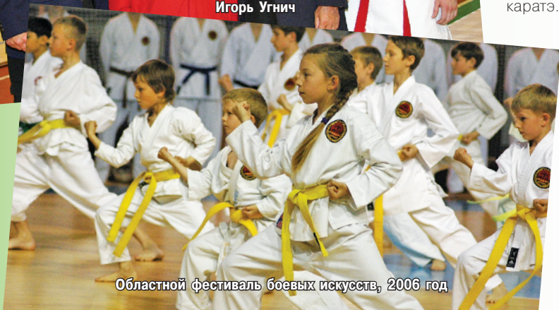
Областной фестиваль боевых искусств, 2006 год