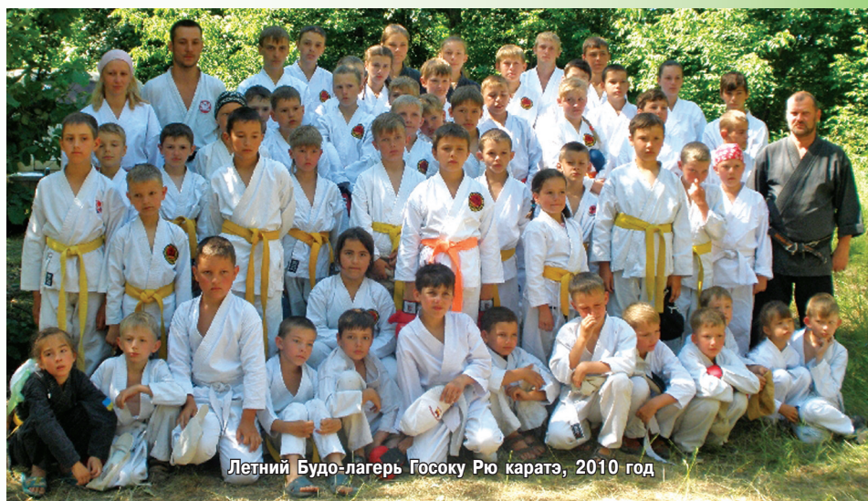
Летний Будо-лагерь Госоку Рю каратэ, 2010 год

Мы продолжаем знакомить с людьми, реально развивающими в нашей стране каратэ Госоку Рю. Сегодня речь пойдет о двух сумских клубах, на которых базируется Представительство ИКА в Украине: Клуб Шотокан Каратэ-до «Терра-SKIF» и отделение каратэ ДЮСШ «Авангард». Их обязательно надо рассматривать вместе, поскольку они вместе несут тяготы организационной и методической работы по внедрению стиля Госоку Рю в Украине, разделяя обязанности и взаимно дополняя друг друга. Удел клуба — традиционное каратэ, продвижение стиля, международная деятельность и опека над сборной Украины. ДЮСШ занимается спортивным направлением и детским каратэ.