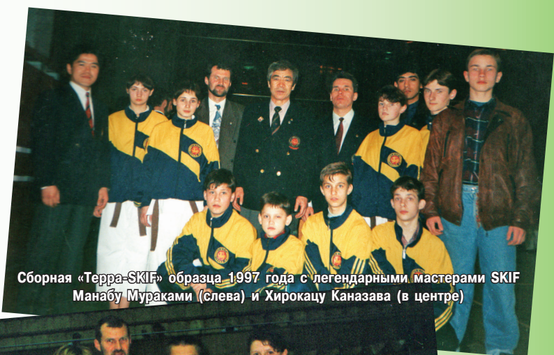
Сборная «Терра-SKIF» образца 1997 года с легендарными мастерами SKIF Манабу Мураками (слева) и Хирокацу Каназава (в центре)