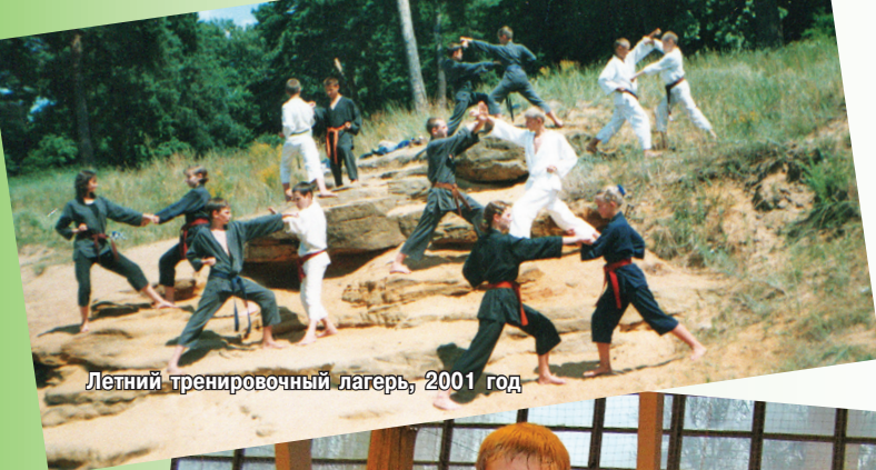
Летний тренировочный лагерь, 2001 год