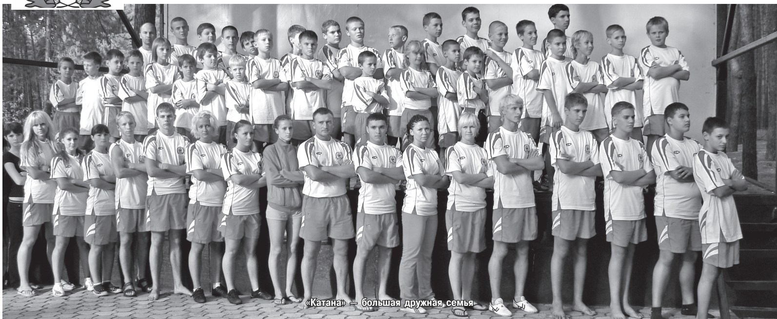
«Катана» — большая дружная семья

Нам очень хочется поделиться тем, чего достиг клуб за эти годы, вспомнить о тех, кто принес дух восточных единоборств в наш город. Разрешите?