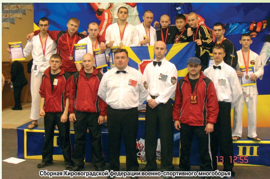
Сборная Кировоградской федерации военно-спортивного многоборья

«Чистый город», «Путь к храму». Проводятся военно-полевые походы по местам боевой славы, встреча с ветеранами Великой Отечественной войны и войны в Афганистане, осуществляются мероприятия по наведению порядка на военных кладбищах. Доброй традицией стали показательные выступления во время празднования Дня Победы, Дня Защитника Отечества, в Дни призывника, а также юбилеев городов и районов области.