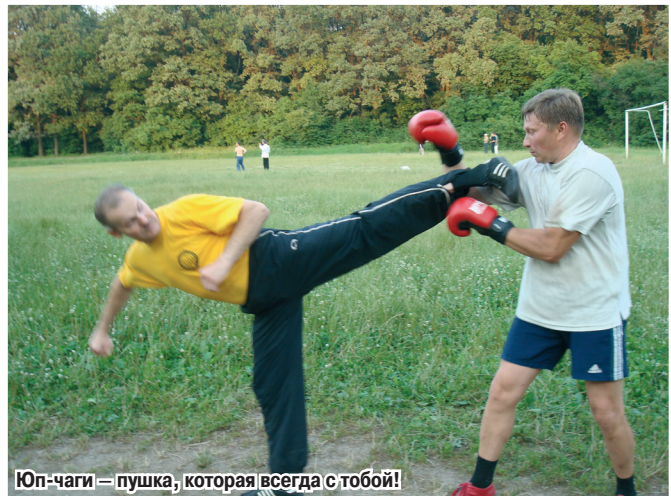
Юп-чаги – пушка, которая всегда с тобой!