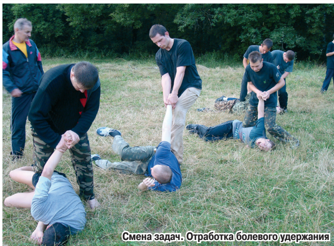
Смена задач. Отработка болевого удержания