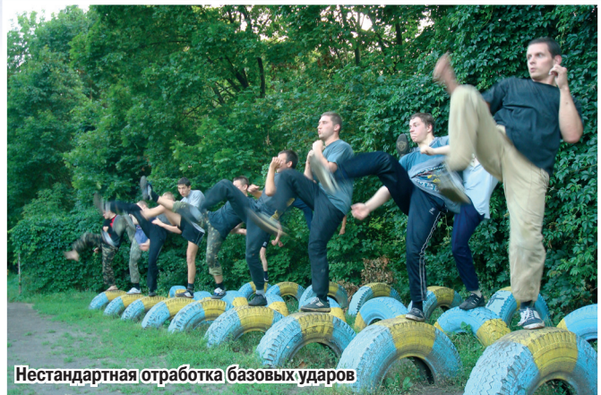
Нестандартная отработка базовых ударов