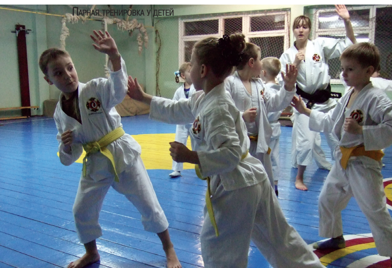
ПАРНАЯ ТРЕНИРОВКА У ДЕТЕЙ