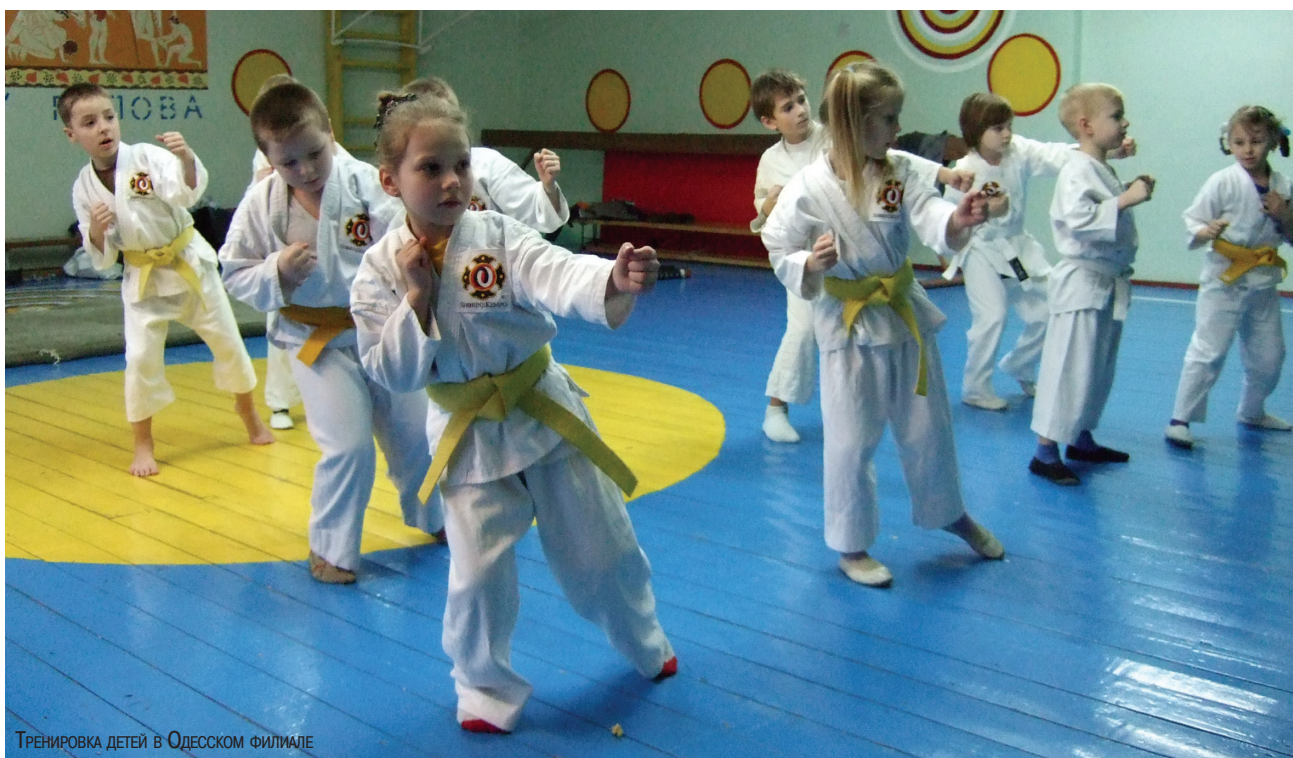
ТРЕНИРОВКА ДЕТЕЙ В ОДЕССКОМ ФИЛИАЛЕ