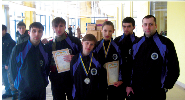
СК «Фанат» с новыми победами возвращается домой