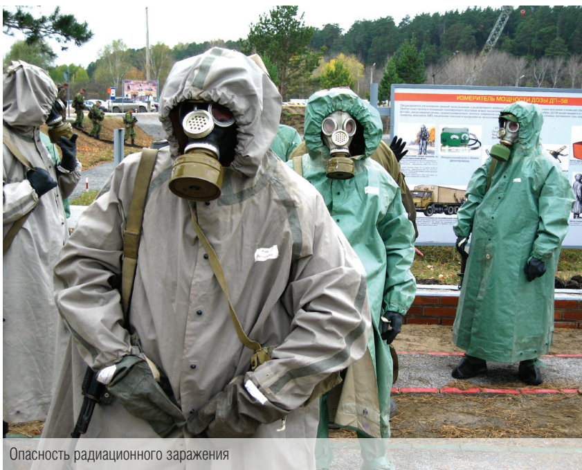
Опасность радиационного заражения

Знаменательным событием в жизни военного института стало открытие памятника-мемориала погибшим выпускникам, состоявшееся 3 июня 2004 года.