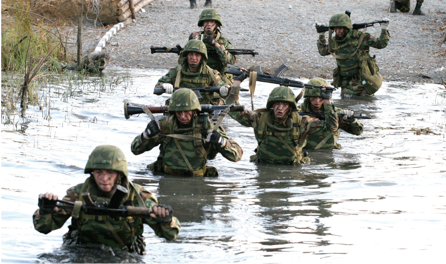
Преодоление водной преграды вброд

Поднять автомат над головой, оттолкнуться ногами и, сгруппировавшись, призем... точнее, приводниться по самые уши в жидкое месиво, именуемое в простонародье «бассейн». Окунулись.