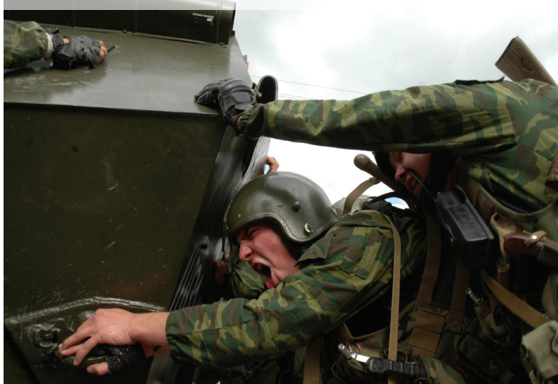
Заводим БТР силами группы