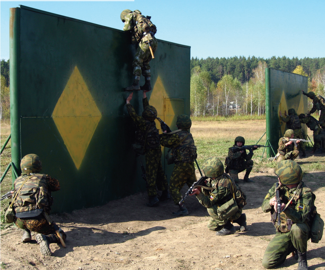
Группа на полосе препятствий

При высоких результатах тестирования, положительной характеристике и медицинских показателях кандидата зачисляют в подразделение специального назначения. Если у аттестуемого низкие показатели в тестировании, то он может быть зачислен в резерв для службы в подразделениях специального назначения.