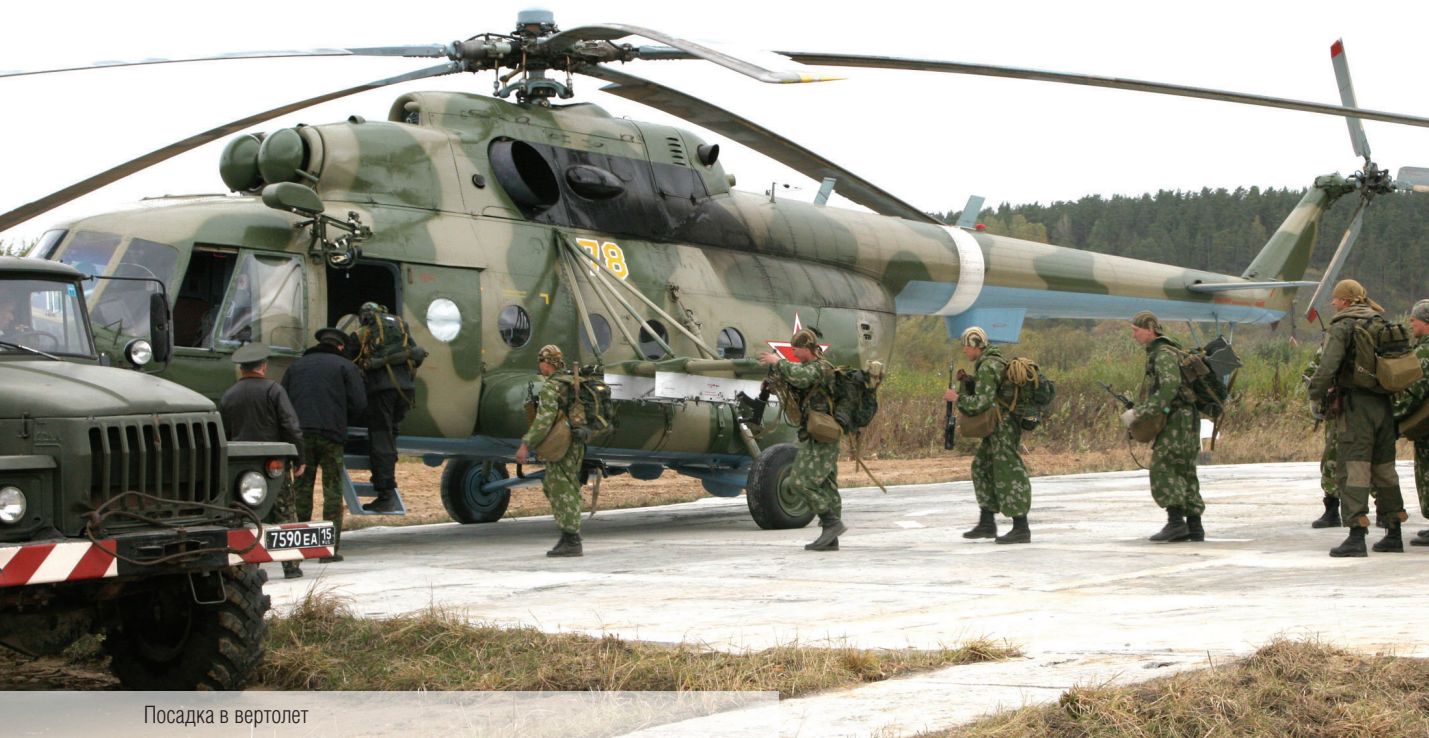
Посадка в вертолет