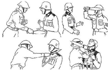
Пример боевого применения сметчета или мачете