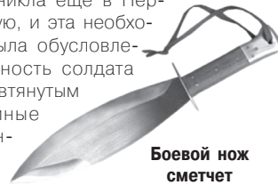
Боевой нож сметчет

ножей возникла еще в Первую мировую, и эта необходимость была обусловлена возможностью солдата оказаться втянутым в траншейные бои. Именно в них все шло в ход, поэтому постепенно в арсенале солдата и появились так называемые тяжелые полевые ножи. В отличие от мачете, они имели толстый массивный клинок и инструментальная задача была для них вспомогательной. Самыми знаменитыми в этом классе стали сметчет — боевой нож, разработанный знаменитым специалистом в области рукопашного боя Уильямом Фэрберном еще во