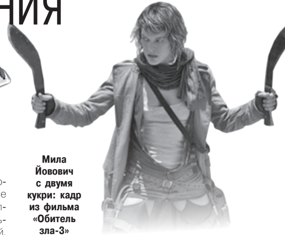
Мила Йовович с двумя кукри: кадр из фильма «Обитель зла-3»

время ВОВ, и кукри — этническое оружие служивших под британским командованием гуркхов. Следует отметить, что именно сметчет не дал мачете занять оружейную нишу.