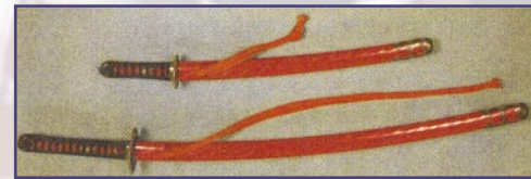
Дайсё — госираэ. Катана и вакидзаси, XVII в. Наодзуми.

В XVI веке получил распространение меч хан-дати — промежуточная форма между тати и катаной. Хандати был похож на меч тати, но его носили за поясом лезвием вверх, как катану.