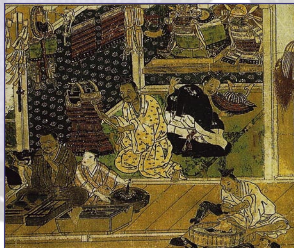
Мастерская по изготовлению доспехов