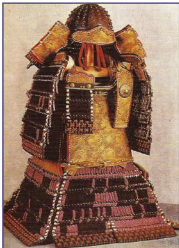
Доспех о-ёрои XI в.

восходит к защитному вооружению Древнего Египта и Ассирии. Заимствовав сам принцип, японцы разработали свой уникальный стиль. В VI и VII вв. пластинчатый доспех представлял собой большой неуклюжий кафтан. Со временем он превратился в те доспехи, которые носили самураи. То были первые настоящие самурайские доспехи, известные как ёрои .