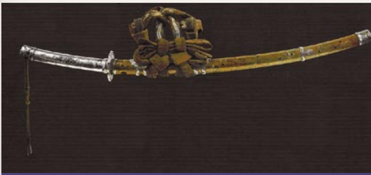
Тати в оправе эфу-но-тати. Принадлежал клану нива. XVIII в.

С доспехами носили итомаки-но-тати («меч, обмотанный нитью»). У этого вида оправы не только рукоять, но и часть ножен была плотно обмотана шелковым шнуром. Обмотка покрывала ту часть ножен, которую обычно придерживали рукой, вытаскивая меч. Часто встречался вариант итомакт-но-тати, который назывался сиридзая-но-тати («меч с ножами на ягодице»), у него ножны ниже обмотки покрывались мехом тигра, вепря или медведя.