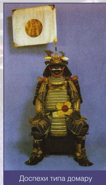
Доспехи типа домару

Чтобы надеть доспехи ёрои, состоящие из двух частей, требовалось слишком много времени, но этому их заменили цельным панцирем того типа, что прежде использовался лишь для вооружения пехотинцев. Исчез кожаный нагрудник, а на смену тяжелой «юбки» ёрои пришли легкие составные набедренники кусадзури , с новой формой для защиты от рубящих ударов, а назатыльник шлема, закрывавший шею, чаще выгибали наружу, а не вниз, что позволяло более свободно манипулировать оружием. Начали носить не один, а два бронированных рукава, усилили лучины. Все эти