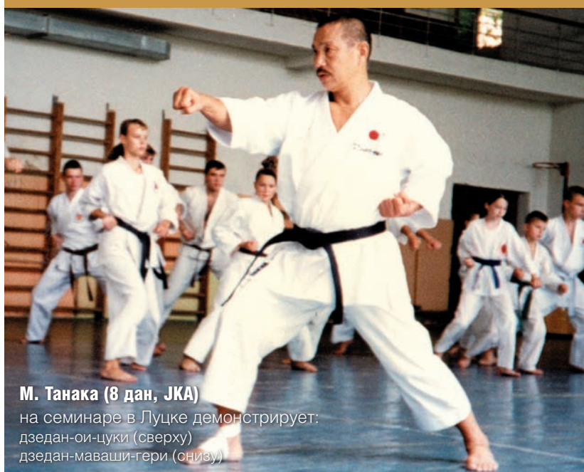
М. Танака (8 дан, JKA)

В центре Канадзава Хироказу — Грандмастер 10 дан. Создатель Международной федерации Сетокан-каратэ (SKI)