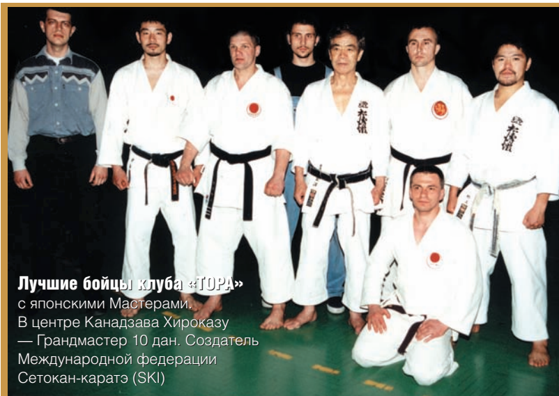
Лучшие бойцы клуба «ТОРА»

Мастер каратэ — это тот, кто «...проникнут уважением к Жизни, но способен в случае крайней необходимости разрушить её...»