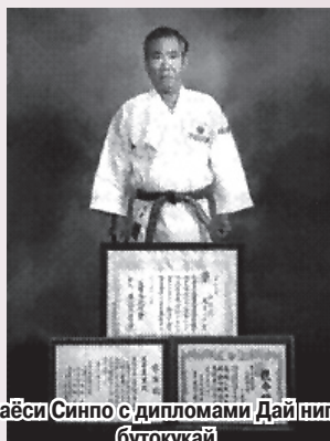
Матаёси Синпо с дипломами Дай ниппон бутокукай

Матаёси Синпо – сокэ матаёси-кобудо, сокэ кингай-рю тодэ-дзюцу и сокэ нанбан сёрин хакуцуру кэнпо тодэ – до конца своей жизни пропагандировал, развивал и распространял систему матаёси-кобудо. Он умер 07.09.1997 г. в возрасте 76 лет.