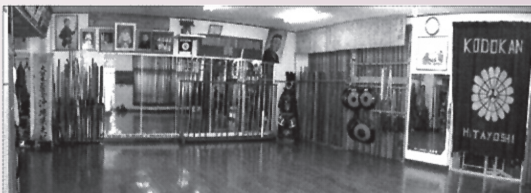
Внутренний вид хонбу додзё «Кодокан» матаёси-ха кобудо, где практикующий: «Совершенствует характер Учится быть преданным семье, школе и друзьям Искренне прилагает усилия Учится уважать других И воздерживаться от насилия»

В 1970 г. Матаёси Синпо на основе Рюкю кобудо кай создал Рюкю кобудо рэнмэй («Федерацию рюкюского кобудо») и в 1972 г. реформировал ее в Дзэн окинава кобудо рэнмэй («Всеокинавскую федерация кобудо»), которая получила официальное признание и на Окинаве, и в Дай ниппон бутокукай. Сегодня это одна из крупнейших организацией кобудо в мире.