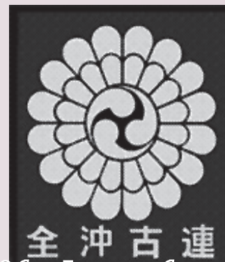
Эмблема Дзэн(окинава)кобудо рэнмэй