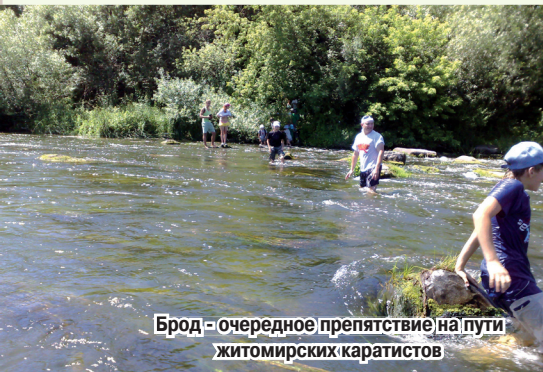
Брод - очередное препятствие на пути житомирских каратистов

Почему изнурительный? Судите сами: до 15 км пешком несколько часов по пересеченной местности, при температуре воздуха + 40°C, с полной экипировкой на себе. В самом конце марша - переход вброд реки Случь. Задача эта была тоже не из простых - в этом месте течение очень сильное, пришлось детей переносить на руках.