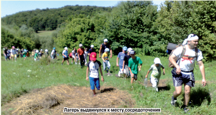
Лагерь выдвинулся к месту сосредоточения