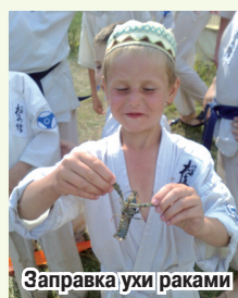
Заправка ухи раками

Последующие 2 дня прошли в тяжелых, но разнообразных и интересных тренировках со строгим соблюдением распорядка дня в лагере: 6.00 – подъем, 22.00- отбой, 4-х разовое питание, готовящееся своими силами из небогатого рациона: консервация,