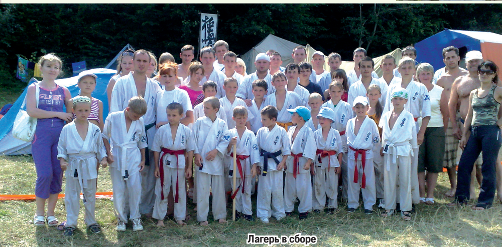
Лагерь в сборе