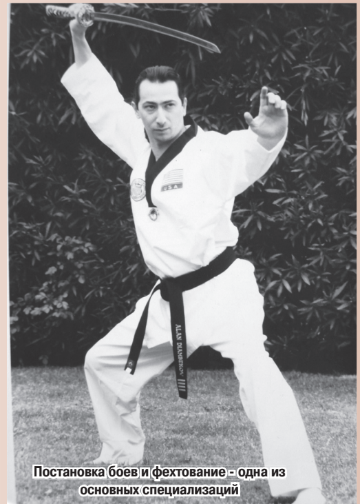
Постановка боев и фехтование - одна из основных специализаций