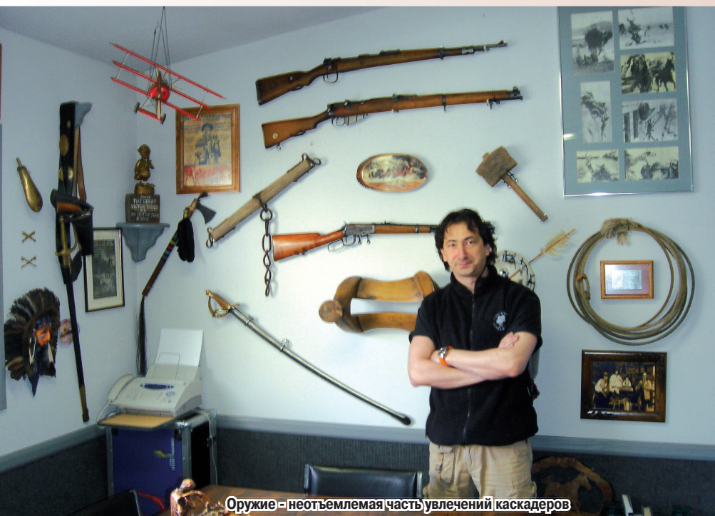
Оружие - неотъемлемая часть увлечений каскадеров

Творческая жилка, по всей видимости, от бабушки ещё пошла, она долгое время работала в коллективе известного фольклорного ансамбля танца «АЛАН». Ну а потом мама естественно