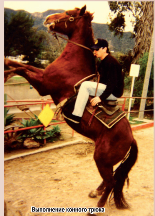
Выполнение конного трюка

Из самых опасных трюков, какие есть на съёмочной площадке, все по праву называют работу с огнем – горение, и это действительно так. Огонь – вещь непредсказуемая. Что касается специфического оборудования, то его очень много абсолютно во всех направлени-