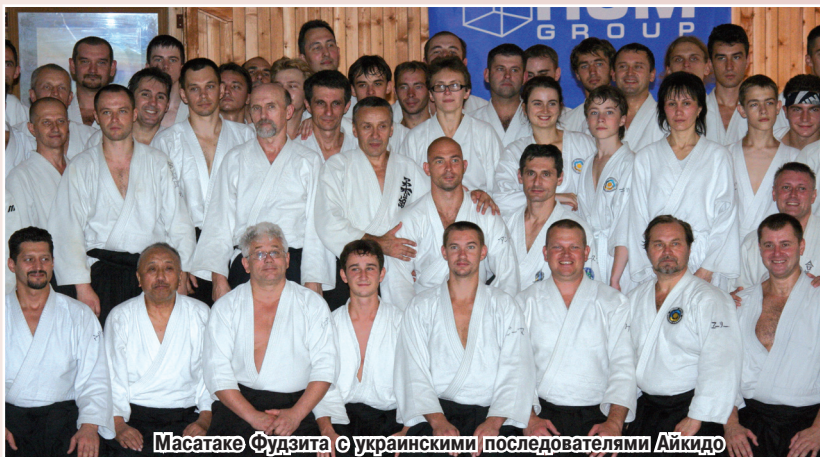
Масатаке Фудзита с украинскими последователями Айкидо

В клубах украинской Ассоциации занимаются не только дети, студенты, взрослые люди, практикующие Айкидо как элемент своего жизненного пути, но и охранные структуры различного уровня, спецподразделения, разработчики антитеррористических программ, Государственный комитет по охране государственной границы. И это далеко не полный перечень приверженцев Айкидо, постигающих это боевое искусство в Ассоциации. Сам Игорю Юрьевич объясняет такой активный интерес к Айкидо следующим образом.