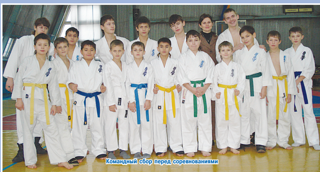
Командный сбор перед соревнованиями

Черниговская Федерация росла и развивалась, росло мастерство тренеров и спортсменов, а также значительно вырос уровень соревнований, в которых принимали участие каратисты. Все это, плюс совокупность некоторых других факторов, привело к тому, что возникла необходимость в создании организации более высокого статуса, чем городская. Так параллельно с городской Федерацией в 2005 г. была создана и зарегистрирована Общественная организация Черниговская Областная Федерация Киокушинкай Каратэ, которая является официальным представителем УФКК в г. Чернигове и Черниговской области; цель этой организации популяризация Каратэ стиля Киокушинкай.