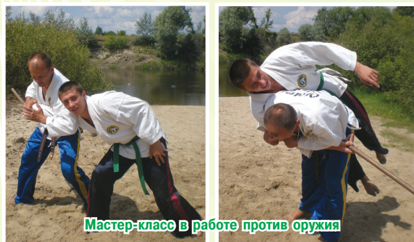
Мастер-класс в работе против оружия

и постоянно совершенствовать свои коронные приемы, а это — строго индивидуально.