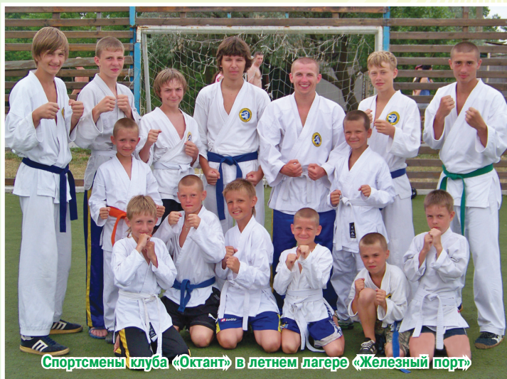
Спортсмены клуба «Октант» в летнем лагере «Железный порт»

Занимающиеся делятся по возрастным группам и по уровню подготовки. Приоритетным в тренировке является индивидуальный, творческий подход к каждому ученику — именно так в максимальной степени раскрываются его способности. На мой взгляд, нет чего-то одного, на что нужно уделять особое внимание. Тренер и ученик должны уделять внимание тем техникам, которые получаются хуже