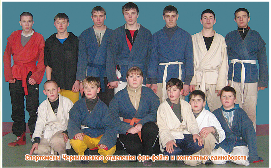
Спортсмены Черниговского отделения фри-файта и контактных единоборств

На вопрос, почему я занимаюсь именно фри-файтом, могу ответить так — этот вид спорта наиболее приближен к реальному бою. В нем разрешено максимальное количество технических действий. Кроме этого, идеология данного боевого искусства нам близка, потому что в ее основе лежат национальные ценности и нацио-