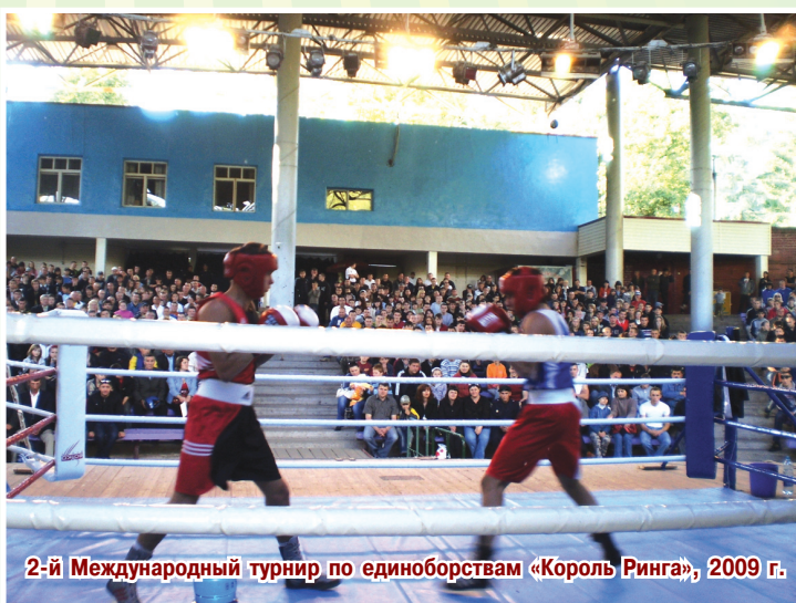
2-й Международный турнир по единоборствам «Король Ринга», 2009 г.