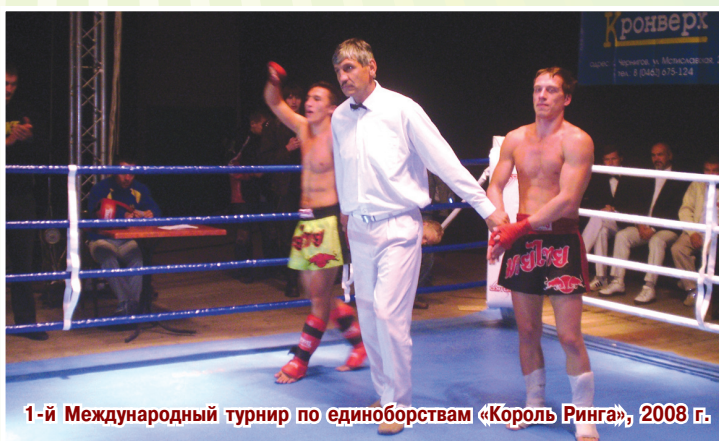
1-й Международный турнир по единоборствам «Король Ринга», 2008 г.