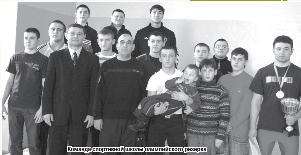
Команда спортивной школы олимпийского резерва

удивить своих коллег – спортсменов, если тебе от души заплодирует тот, кто сам варится в этой кухне и знает, что в ней и как, считай, что ты стал Мастером».