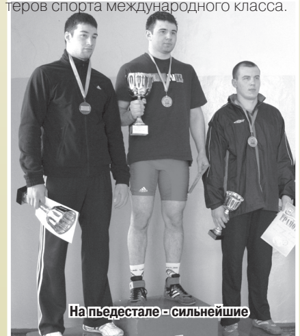
На пьедестале - сильнейшие

За годы существования Тернопольская борцовская школа подготовила 12 чемпионов, победителей и призёров СССР, 87 чемпионов Украины, 4 чемпионов, победителей и призёров Европы, 3 чемпионов Кубка Мира, победителей первенств мира среди кадетов, 2 участников летних Олимпийских игр в Атланте 1996г., 147 мастеров спорта, среди которых 9 мастеров спорта международного класса.