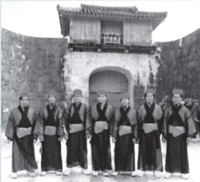
Возможно, так выглядели средневековые пэйтины Окинавы

Вследствие своего уникального географического положения Окинава представляла лакомый кусок для сильных соседних держав, но правители Окинавы более тяготели к Китаю, так как признание вассальной зависимости от китайской династии Мин обеспечило Окинаве режим наибольшего благоприятствования в торговле, и в средние века Окинава имела более 40 торговых представительств в соседних странах, в том числе в Китае, Японии, Корее, Вьетнаме, Малайзии, Индонезии, Лаосе, Бирме и др. Вообще, XIV-XV вв. называют «золотым веком торговли на Окинаве». Так, в 1404 г. на Окинаве открывается торговое представительство Сиам (Тайланд), в 1425 г. в Сиаме открывается торговое представительство Рюкю, в 1428 г. начинаются торговые отношения между Рюкю и Суматрой, в 1430 г. возникают торговые отношения между Рюкю и Явой, в 1431 г. Рюкю устанавливает дипломатические и торговые отношения с Кореей. Развитие торговых отношений также способствовало тому, что на Рюкю стекались гонимые политическими преследованиями беженцы из соседних стран.