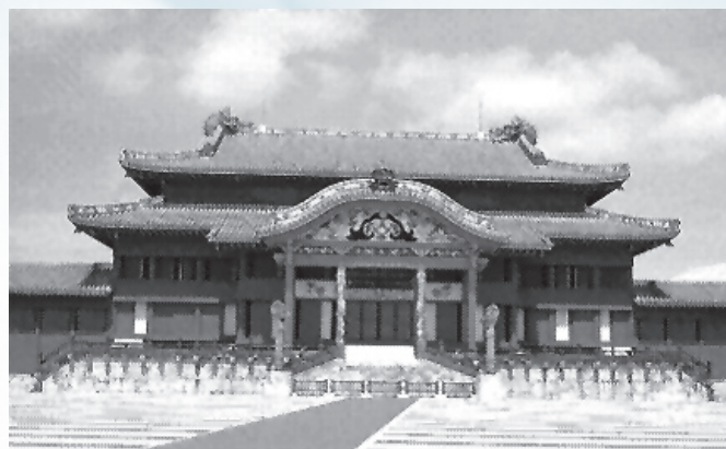
Императорский дворец в Сюри

В 1477 г. король Сё Син ввел запрет на владение и ношение оружия. Все оружие было конфисковано и хранилось в замке Сюри-дзё. С того времени оружием обладали только личные телохранители Сё Сина. Этот факт исследователи истории окинавского каратэ позиционируют как побудительный мотив того, что рюкюсцы стали практиковать искусства тодэ («китайская рука») и кобу-дзюцу («древнее воинское искусство»). Однако, простые люди на Рюкю никогда не имели и не могли иметь оружия, а потому этот запрет больше бил по рюкюсской аристократии и это не удивительно – Сё Син попросту боялся, что его свергнут силой оружия.