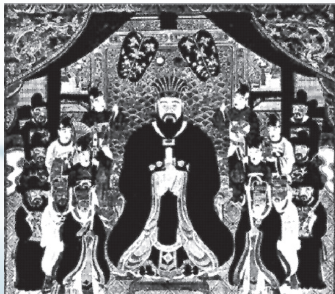
Фреска с изображением короля Сё Сина

В 1402 г. малоизвестный, но очень хитрый и изворотливый нандзанский андзи Сасики Хаси («Низкорослый Сасики») сверг андзи Адзато в Урасое, затем в 1407 г. сверг тюдзанского правителя Бунэя, в 1419 г. разгромил правителя Хокудзан и захватил замок Накидзин. В 1429 г. Хаси победил правителя Нандзан и впервые объединил весь архипелаг Рюкю под своей властью. (В 1428 г. Хаси перед замком Сюри построил Тюдзэн мон или «Врата Тюдзан»). Так возникло «Королевство Рюкю», формально просуществовавшее до 1879 г., и первая династия Сё (кит.: «Шан») с ее первым фактическим королем Сё Хаси, время правления которого характеризуется значительным экономическим подъемом. Но в 1470 г. Канэмару Утима («министр внешней торговли» в рюкюском правительстве) сверг Сё Хаси и основал вторую династию Сё , приняв имя Сё Эн.