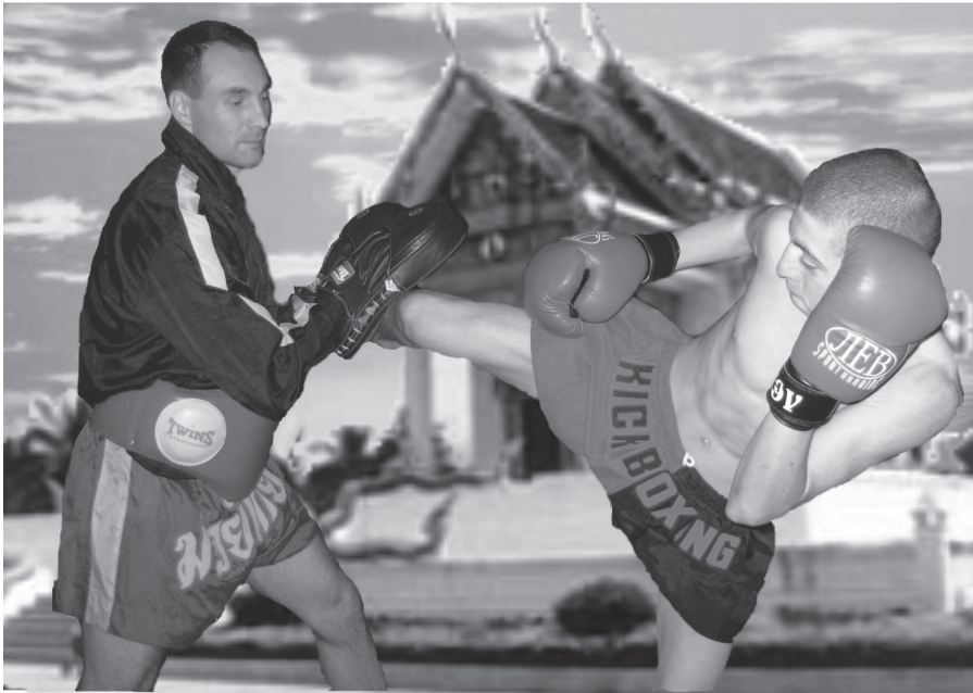
Отработка удара голенью