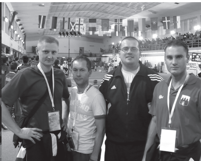
На международном турнире «Кубок Варшавы»

Особенно сильная поддержка оказывается в развитии тхэквондо ВТФ в Прикарпатье военно-спортивному лицу – большинство призеров и чемпионов соревнований разного уровня вышло именно из него!