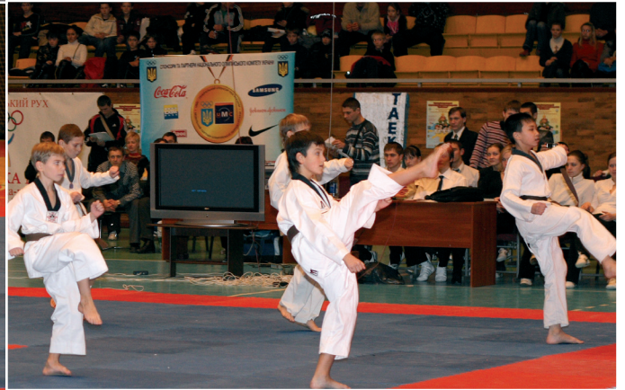
Показательные выступления на IX-м Международном предновогоднем турнире по тхэквондо ВТФ «Дети Украины»

ФТУ (ВТФ) активно работает с подрастающим поколением. В рамках этой деятельности с 1997 года проводится турнир «Дети Украины», который проходит под лозунгами «Ни дня без спорта!» и «Тхэквондо ВТФ против правонарушений и наркомании».