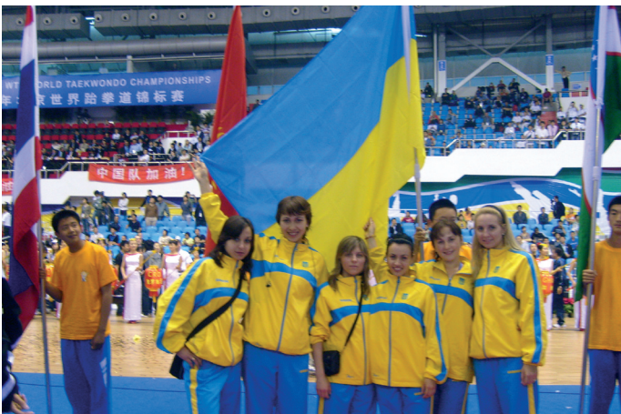
На Чемпионате мира по тхэквондо в Китае, май 2007

4. На протяжении двух месяцев провести семинар для всех тренеров ФТУ по правилам соревнований, медицинскому обеспечению и оказанию первой помощи, технике безопасности во время проведения соревнований по тхэквондо ВТФ.