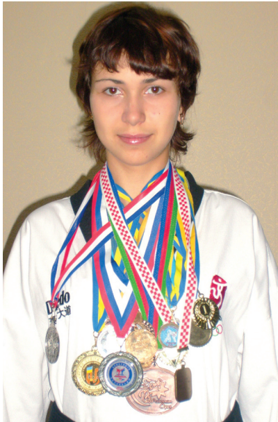
Марина Конева, бронзовый призер Чемпионата Европы в Риме, 2008 г.