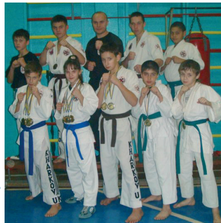
Команда «Торнадо», представленная на Кубке Украины

На Открытом Кубке Украины по Кэмпо клуб «Торнадо» представляли 20 спортсменов. Отличная подготовка отразилась на результатах соревнований. В активе клуба 15 золотых, 15 серебряных и 5 бронзовых медалей.