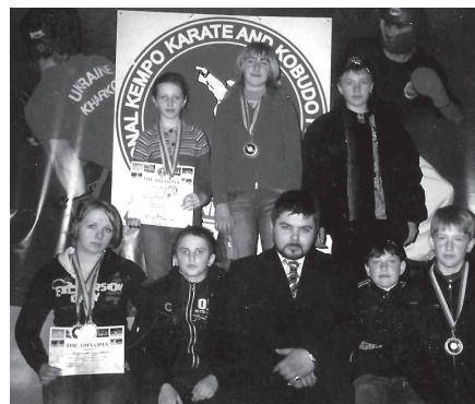
Лагерь Сохэй 2008

Уже многие годы в поселке Старый Салтов, Волчанского района Харьковской области, существует клуб «Ке-до» который в этом году празднует свое пятилетие. В переводе с японского «Ке-до» означает учение пути. В течение пятилетнего существования клуба в нем занималось более 150 спортсменов, которые завоевали более 4000 медалей на различных соревнованиях. В этом клубе тренируются спортсмены различного возраста. Они принимают участие в турнирах различного уровня от чемпионата Харькова до Кубка Европы.