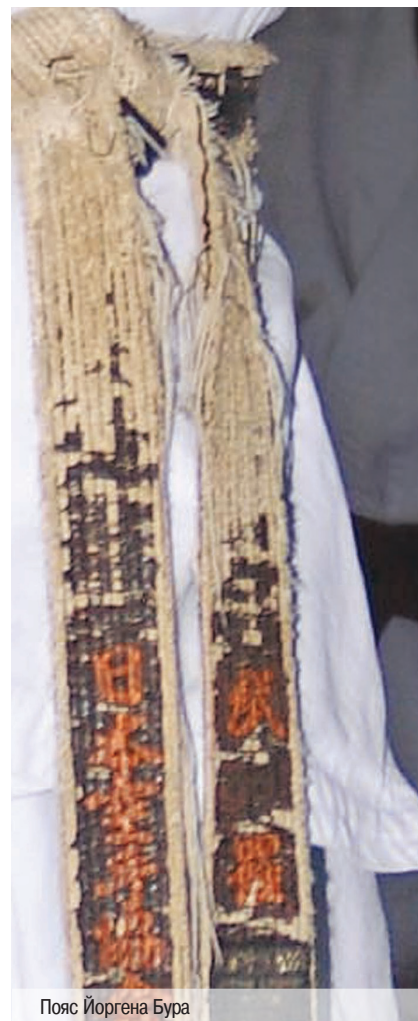
Пояс Йоргена Бура